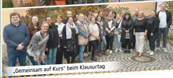
„Gemeinsam auf Kurs“ beim Klausurtag

kopf, Lahn-Dill-Kreis und Main-Kinzig-Kreis wurde auch die sozialraumorientierte Arbeit weiter etabliert. Im Lahn-Dill-Kreis werden derzeit acht Kommunen im Rahmen der Familienzentrumsarbeit unterstützt.