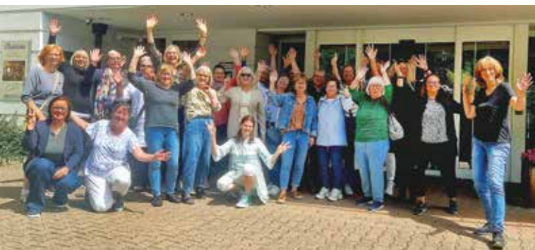
... und ein Erinnerungsfoto beim Pflegemütterwochende