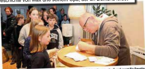
Andreas Steinhöfel liest aus seinem Werk „Wenn mein Mond deine Sonne wäre“ und sorgt für Emotionen unter den Besuchern. Anschließend signiert er Bücher der Zuhörer.

„Wenn mein Mond deine Sonne wäre“ Autor Andreas Steinhöfel liest in Cölbe aus einer berührenden Geschichte von Max und seinem Opa, der an Demenz leidet