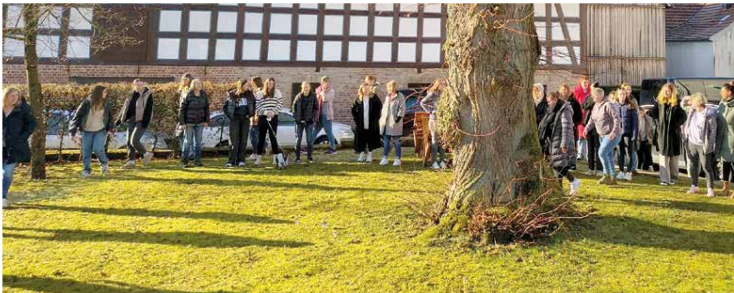
Gemeinsam in Bewegung: Besser als mit diesem Foto kann die Arbeit „für Mädchen* und junge Frauen* nicht dargestellt werden.