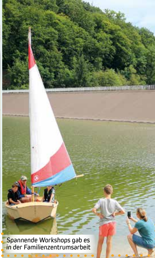
Spannende Workshops gab es in der Familienzentrumsarbeit