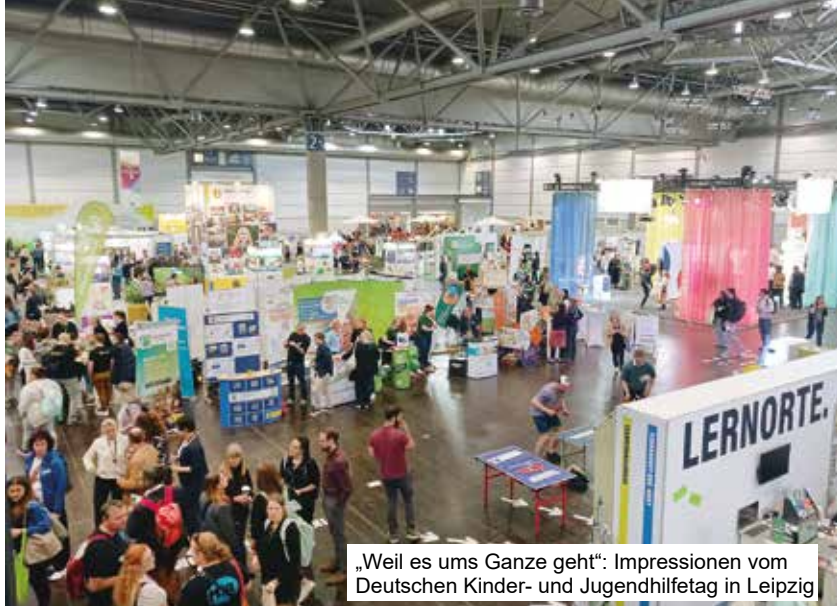
„Weil es ums Ganze geht“: Impressionen vom Deutschen Kinder- und Jugendhilfetag in Leipzig