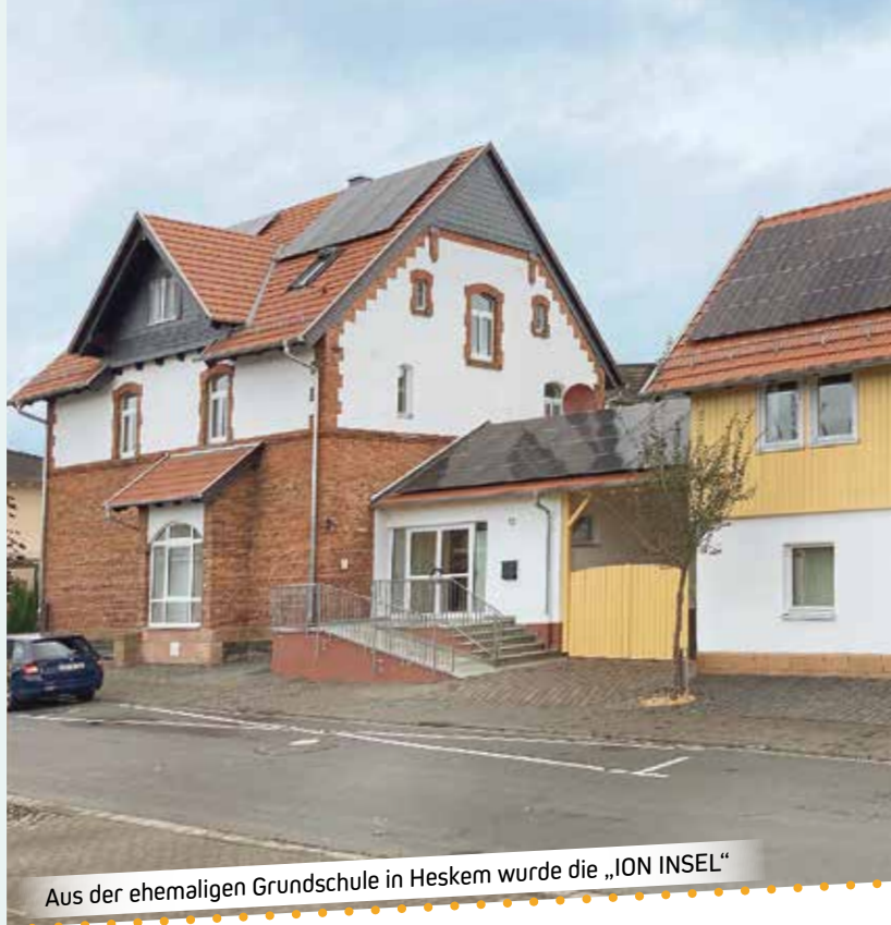
Aus der ehemaligen Grundschule in Heskem wurde die „ION INSEL“