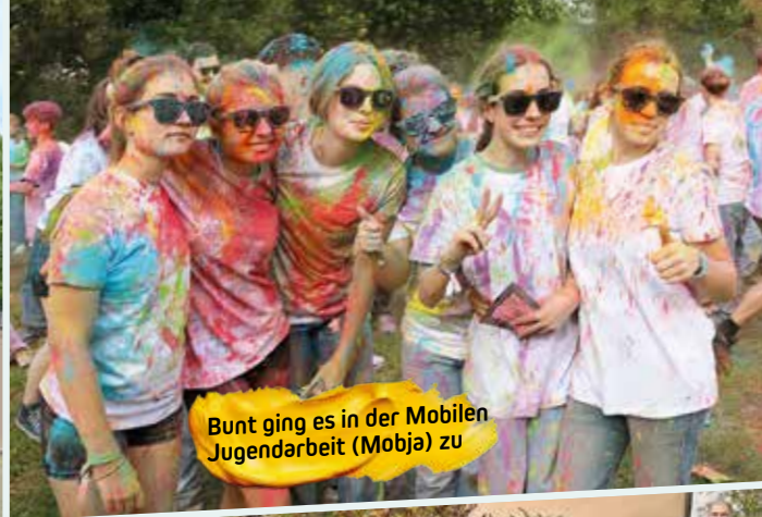
Bunt ging es in der Mobilen Jugendarbeit (Mobja) zu