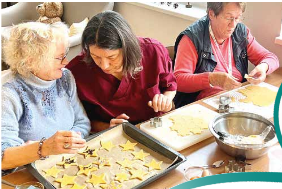
Plätzchen backen gehört in der Adventszeit einfach dazu: auch in der Tagespflege in Wetter

„Die Altenhilfe im St. Elisabeth-Verein befindet sich derzeit in einer guten Phase der Konsolidierung. Die wirtschaftliche Situation zeigt wieder positive Anzeichen der Besserung.“